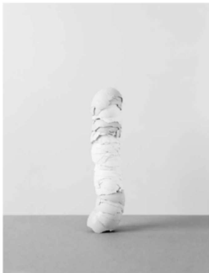
Filigrana, apitea, editura M. Ana Trand.