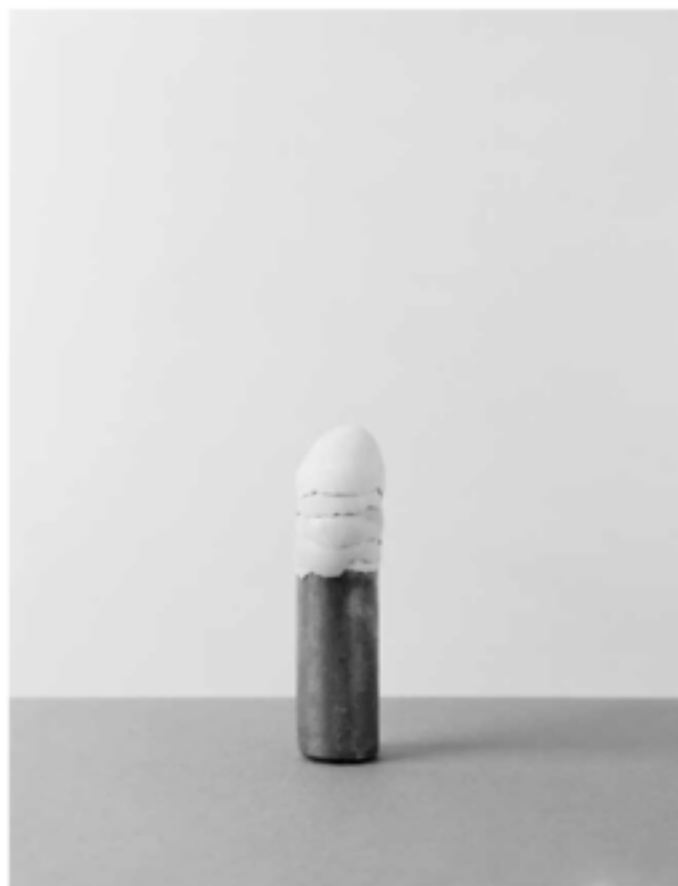
Filigrana, apitea, editura M. Ana Trand.