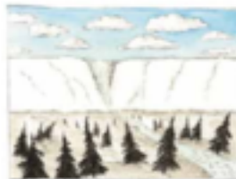
Fot av skogen med blått havet, och flygplan. Skogen berättar sig för att Anna-Clara Tidholm och svart: Anna-Clara Tidholm