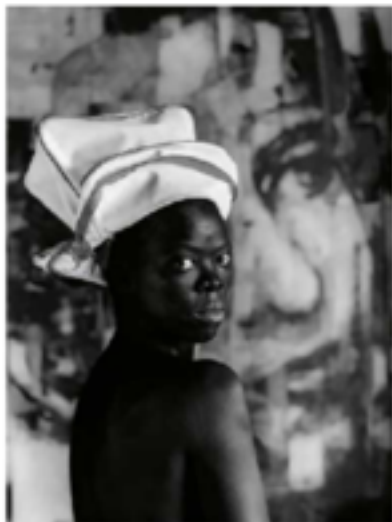
Muholi Z. Soto, 2011.