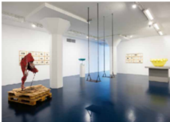
Like a Prayer, Magasin III.

Det är en uttryckssätt som med sin förmåga att berätta om katastrofer och om människors liv i dessa svåra situationer kan ge oss en annan syn på världen och på oss själva. Det är en uttryckssätt som med sin förmåga att berätta om katastrofer och om människors liv i dessa svåra situationer kan ge oss en annan syn på världen och på oss själva.