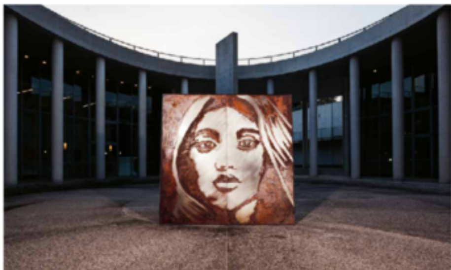
Fotograf av Karen Östling och Erik Ravald. Foto: Tobias

AVESTA ART 2016 en tydligt uttryck på konst och kultur i Bergslagen (2008-2016) i syfte att lyfta fram ett antal bergslagskulturella centrum, som kulturhistoriska och