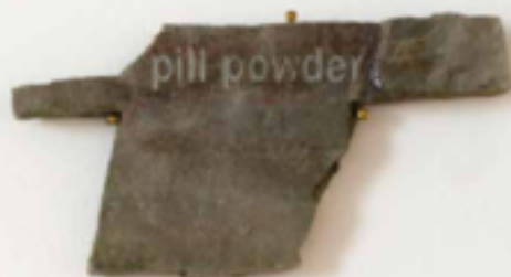
Pill powder. Flora F. Seger.