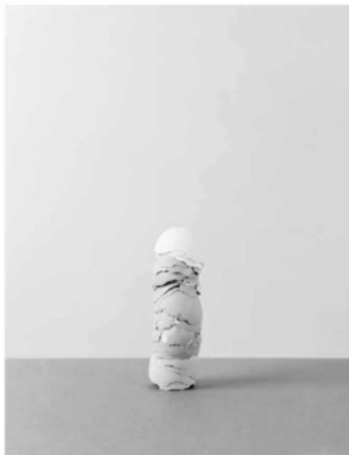
Filigrana, apfite, editura M. Ana Trand.