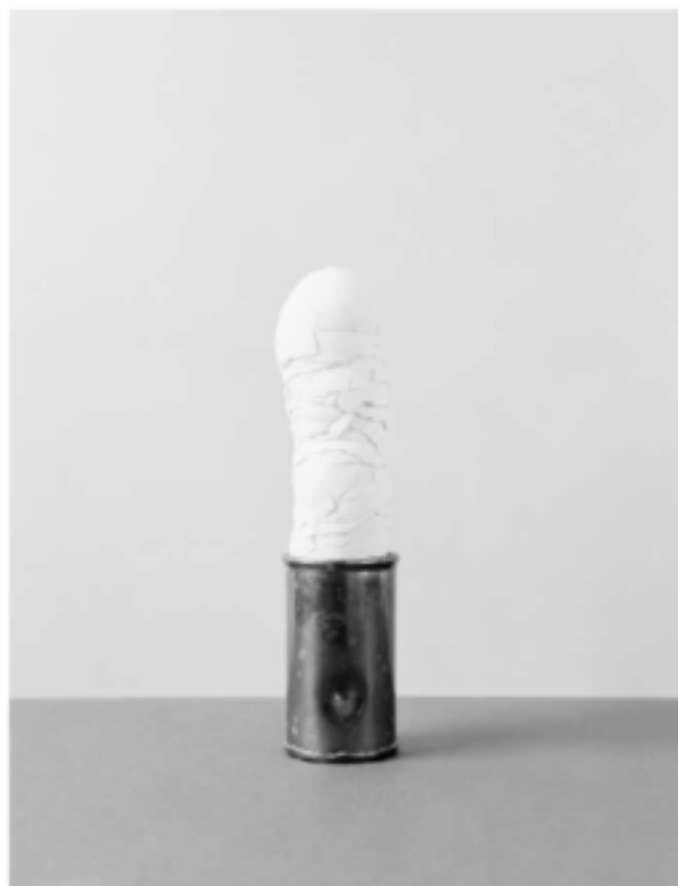
Filigrana, apfite, editura M. Ana Trand.