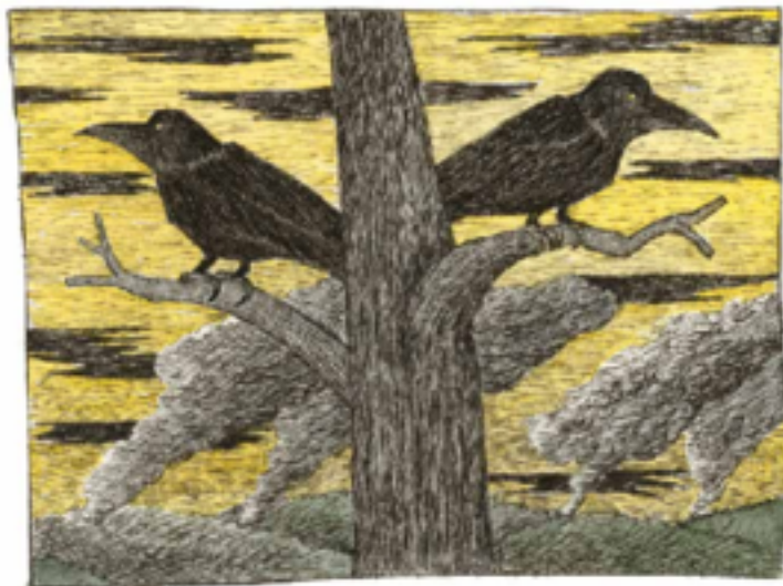
Slagens historia för vuxna. De två stora svarta fåglarna. Bild och text: Anna-Clara Tidholm.

I båda berättelser är det starkt på den tredje dagen som naturen blir till: