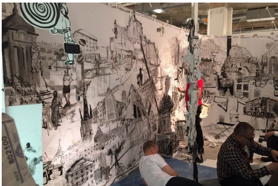
Glädjemännen, (pågående skapande) Galleri Se Konst, Falun, Sverige.