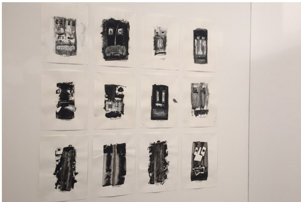
Al-Mahatta Gallery, Ramallah, Palestina.

Supermarkets roll som konstvärldens enfant terrible, och pratar själva om årets mässa som ett kreativt kaos: risktagande, disparat, ärligt och kul. De beskriver de konstnärdrivna gallerierna som laboratorier för samtidskonst, där man vågar testa sådant som vanligtvis inte kommer in på de kommersiellt drivna gallerierna.