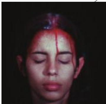
"Sweating blood", 1973.

Den spanske surrealisten Joan Miró (1893-1983) tillhör 1900-talets stora mästare. I Waldemarsuddes utställning visas hans poetiskt visionära måleri, skulpturer, teckningar och textila verk, valda med fokus på den konstnärliga arbetsprocessen. Miró inspirerades av vardagliga objekt men var också socialt engagerad.