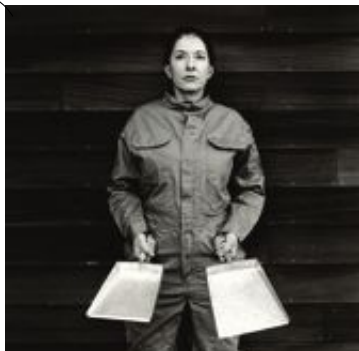
"The cleaner", 2009.

Serbiskan Marina Abramovic har sedan 70-talet arbetat med performance som tänjer konstens gränser. Moderna i Stockholm gör nu hennes första betydande retrospektiv i Europa, med verk om kropp och tid, förlust och minne, makt och hierarkier. Hon gör även ett körverk för Skeppsholmskyrkan.