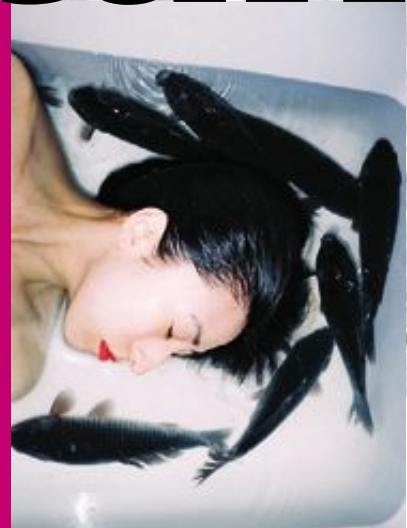
Fotografen Ren Hangs bilder visas på Fotografiska museet.