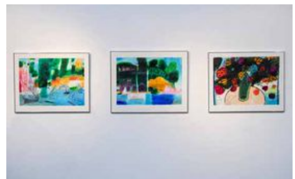
Platser som finns, eller skulle kunna finnas, syns i Signar N Bengtssons konst.