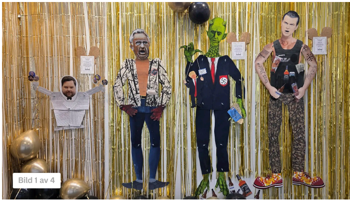
Trumps vicepresident J D Vance med rådgivare och ministrar som sprattelgubbar hos Cluster på Supermarket.

Den Berlin-baserade iranska organisationen Bast samlar kollektiva konstprojekt från Iran på en informativ hemsida. Bland båsens enkla utskrifter ser jag ett foto av personer som läser böcker i en park. Men redan efter några tillfällen blev denna ficka av frihet för mycket för moralpolisen som omöjliggjorde fler sammankomster.