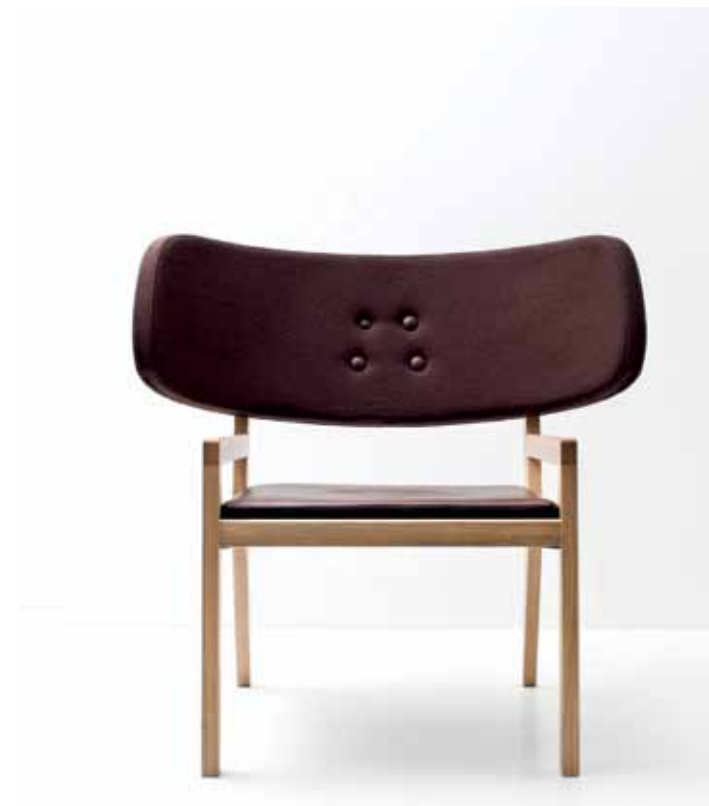
GamFratesi, 'Cartoon Swedese'. Te zien op de Stockholm Furniture & Light Fair.

een dagje later begint Supermarket. Deze beurs voor hedendaagse kunst won vorig jaar de BUS Award, uitgereikt door de Zweedse vereniging voor auteursrecht inzake beeldende kunsten. Met zijn 80 exposanten uit 30 landen is het één van de belangrijkste internationale kunstevenementen in Scandinavië.