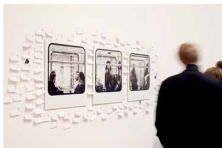
Post-its zijn hét communicatiemiddel op Art Truc Troc. U hangt een post-it met uw voorstel en contactgegevens naast het werk van uw keuze. Nadien beslist de kunstenaar of hij contact opneemt en ingaat op dit voorstel.