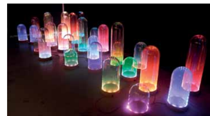
Studio Drift, 'Nola, Buhtiq31'. Te zien op OBJECT Rotterdam.

Affordable Art Fair Tour & Taxis Brussel www.affordableartfair.com 07-02 t/m 10-02