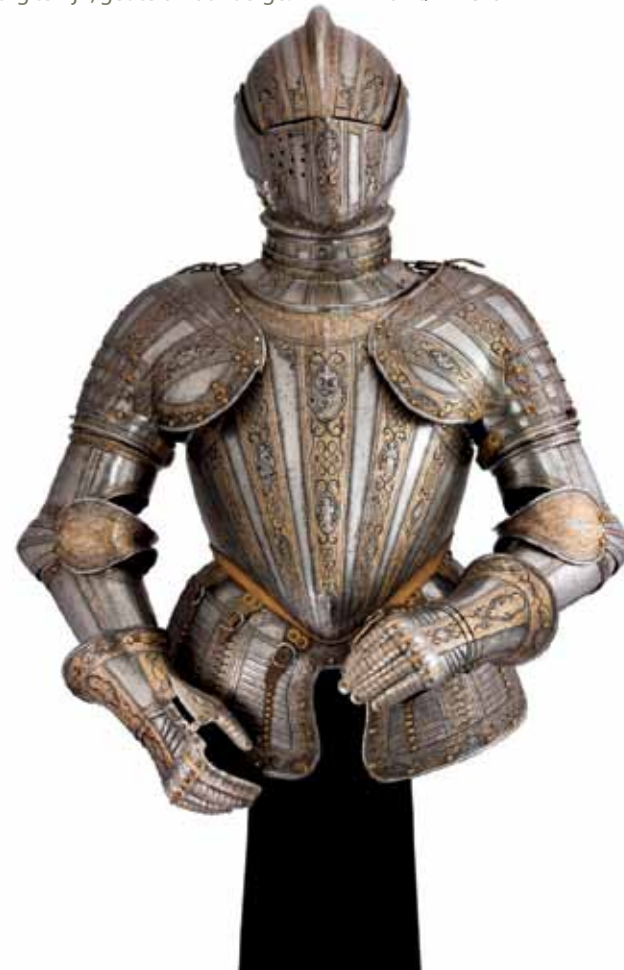
Harnas, te zien bij Peter Finer (Londen) op The American International Fine Art Fair.

Miami Art + Design Bayfront Park Pavilion Miami www.miamiartanddesign.com 14-02 t/m 18-02