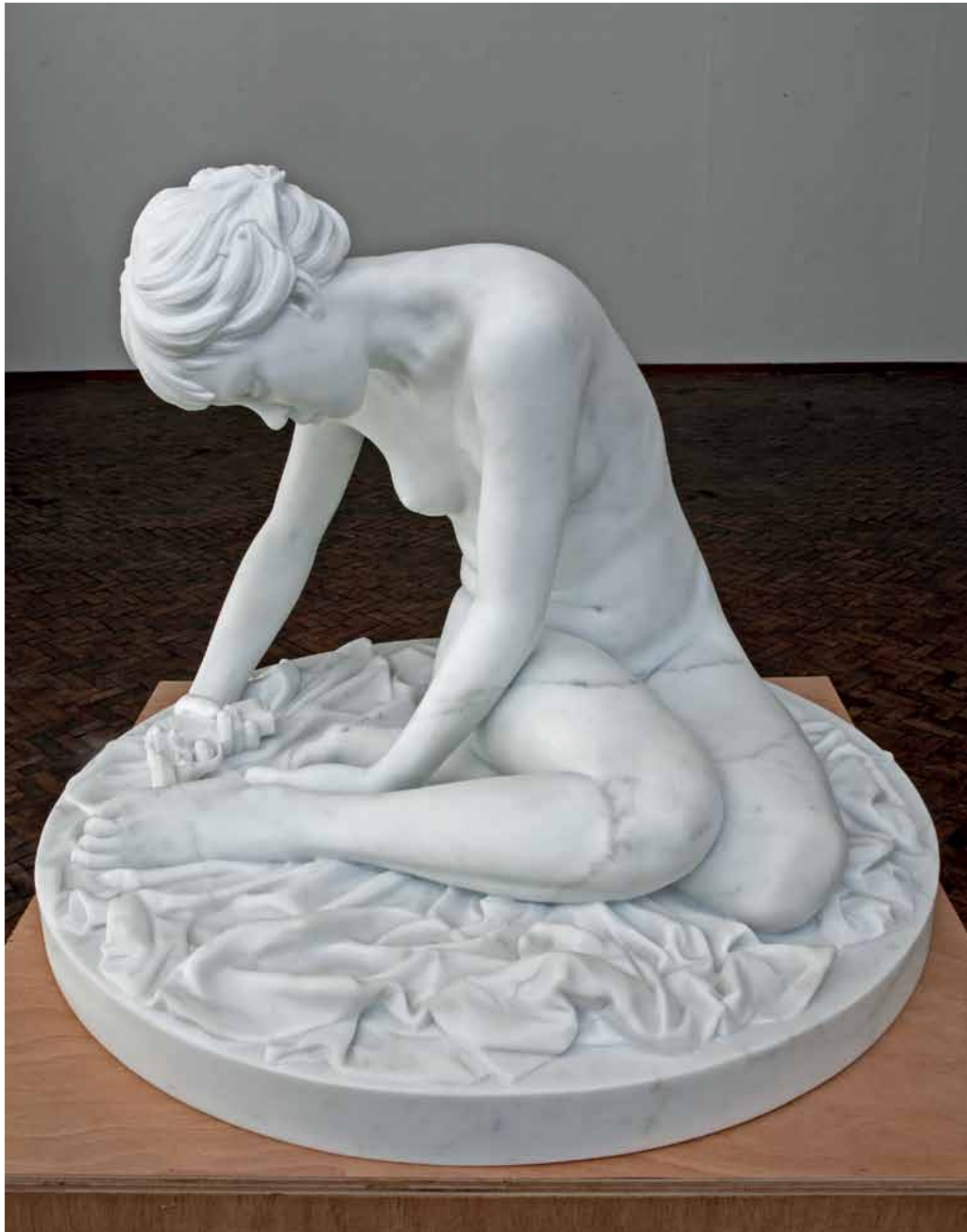
Thom Puckey, 'I.S. with Beretta M92 Semi-automatic', 2011. Marmer. 90 x 90 x 70 cm. Te zien bij Mieke van Schaijk op RAW Art Fair.